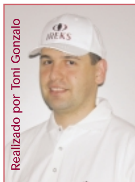
Realizado por Toni Gonzalo