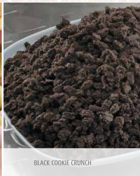
BLACK COOKIE CRUNCH