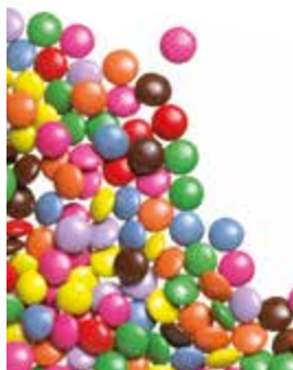
CHOCOLINOS DE COLORES