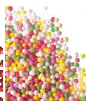
PERLAS DE COLORES