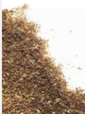
AZÚCAR CRUJIENTE GRANULADO