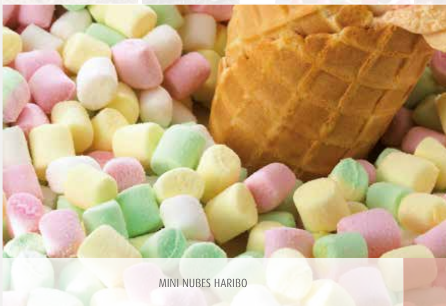
MINI NUBES HARIBO