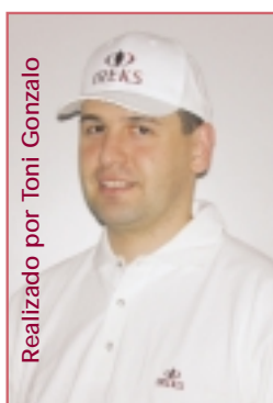
Realizado por Toni Gonzalo