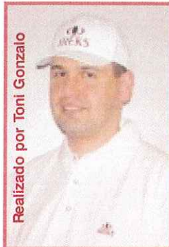
Realizado por Toni Gonzalo

Los Panellets son unos sabrosos dulces muy tradicionales, que al igual que otros alimentos también admiten la innovación. Es por ello que les quiero presentar una gama de panellets como complemento a los más tradicionales elaborados con los exclusivos aromas y colorantes de DREIDOPPEL.