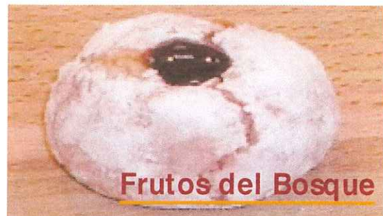
Frutos del Bosque

Una vez frío rellenar el agujero con topping Els- flip Frutos del Bosque