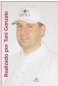
Realizado por Toni Gonzalo